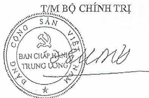
Võ Văn Thường